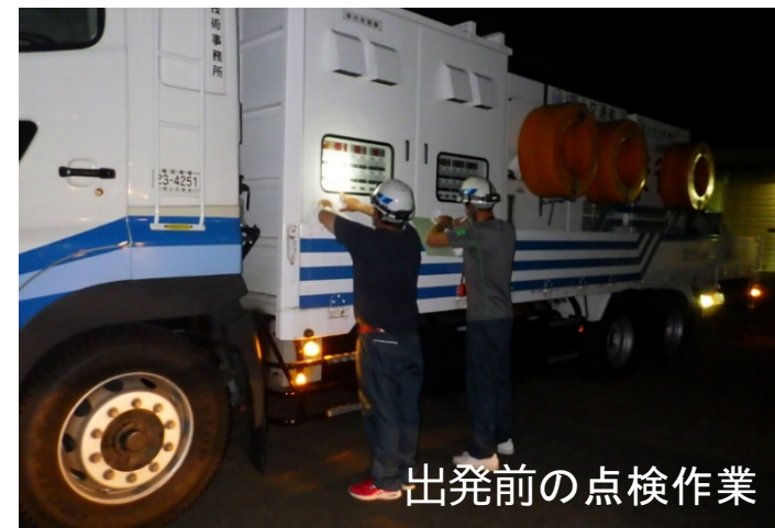
出発前の点検作業