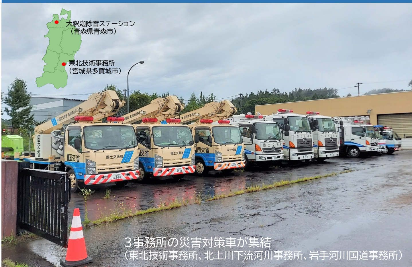
3事務所の災害対策車が集結 (東北技術事務所、北上川下流河川事務所、岩手河川国道事務所)